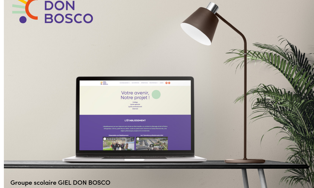
Groupe scolaire GIEL DON BOSCO