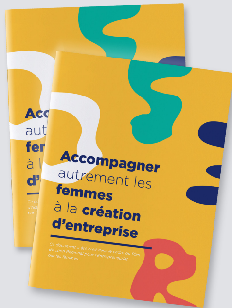
Club Normandie Pionnières, région Normandie et Préfecture Normandie