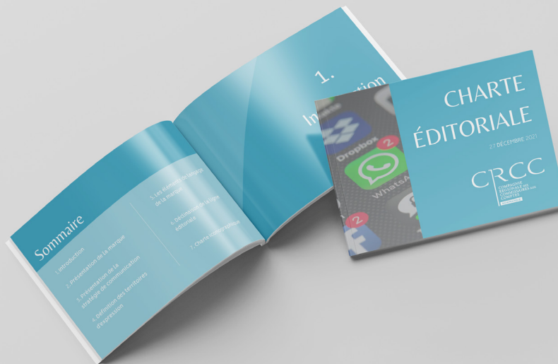
CRCC - Compagnie Régionale des Commissaires aux Comptes