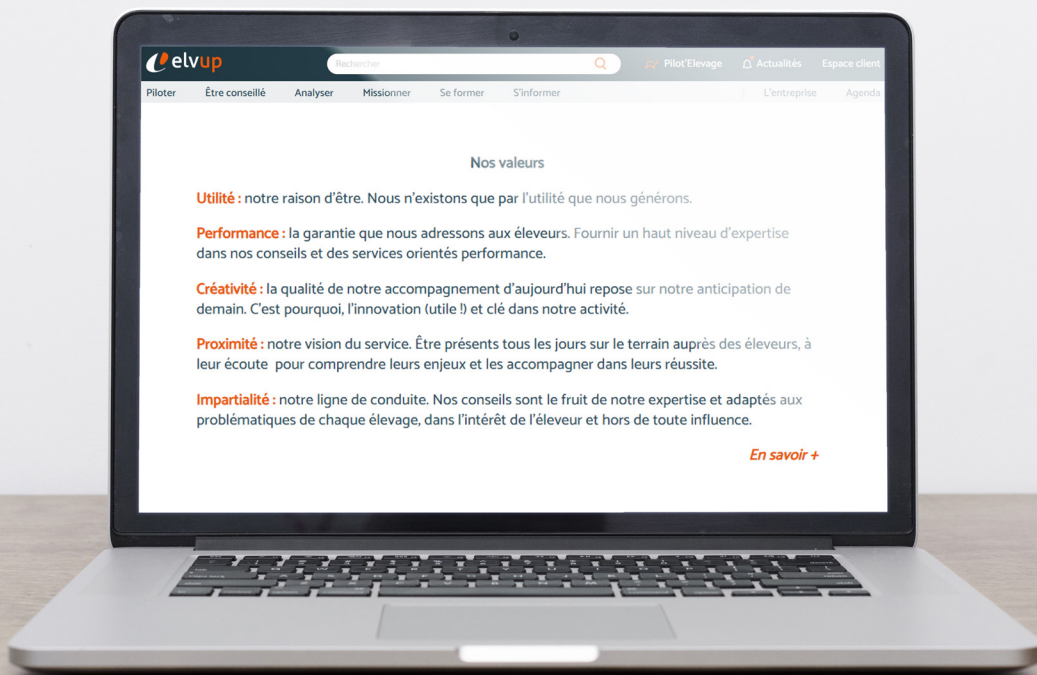
ELVUP - Référent des producteurs de lait et de viande bovine de l'Orne