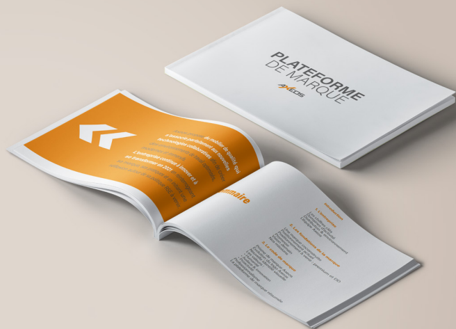
AXEOS - Spécialiste en aménagement d'espaces connectés