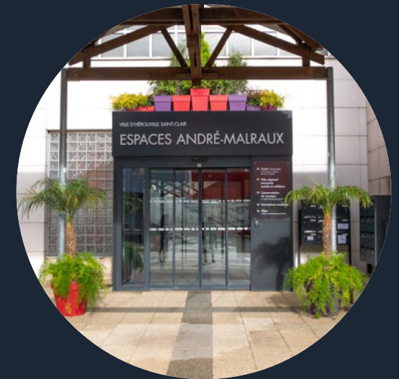
Image in France 2 Rue de la Cotonnière 14 000 CAEN